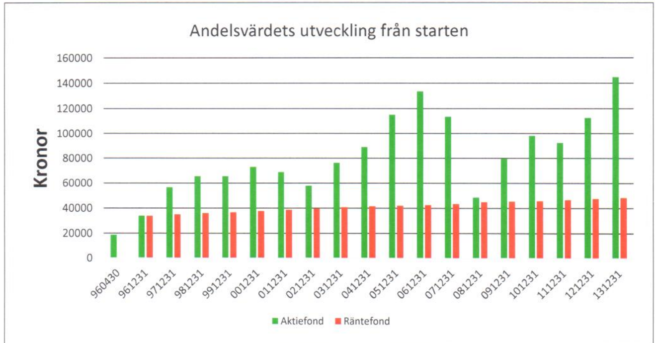
Diagram som visar värdeutvecklingen av Aktiefondandelen i jämförelse med Swedbanks aktie respektive Stockholmsbörsen